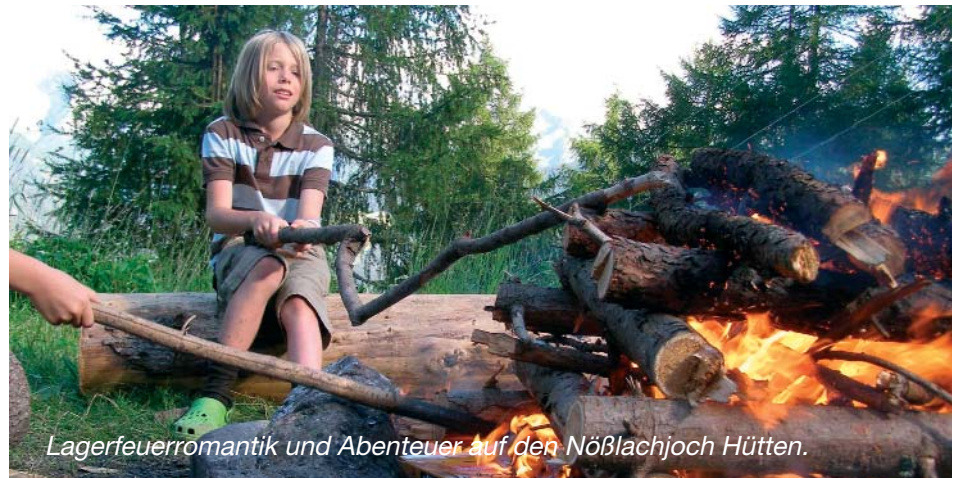
Lagerfeuerromantik und Abenteuer auf den Nöblachjoch Hütten.

Weitere Informationen nach Ostern im Pfarramt Auferstehungskirche Tel. 0512/34 44 11 und bei Gregor Örley unter 0650-26 40 900.