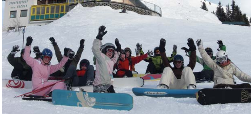
Die Teilnehmer am Wintercamp 2009, gesund und munter und bei bester Laune.