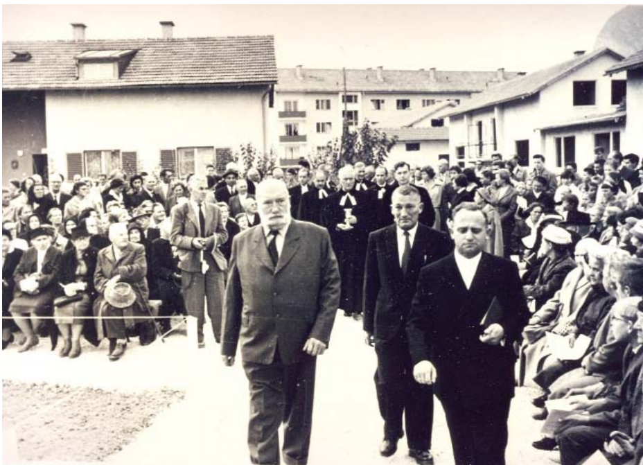
Einzug der Ehrengäste bei der Einweihung am 11.10.1959

lichen Gottesdienst ihrer Bestimmung. Aus vormals deutschsprachigen Gebieten im Osten Europas geflüchtete oder vertriebene Menschen haben erst wenige Jahre zuvor und nach längerem Aufenthalt in den Flüchtlingslagern in Kematzen i.T. und in Haiming hier in Völs ein neues Zuhause gefunden. Sie stehen vor einem Neubeginn. An Gütern arm, aber reich an geistigen Werten, wollen sie nun auch eine Kirche bauen.