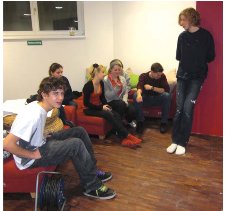
Pause im neu gestalteten Jugendraum der Christuskirche.