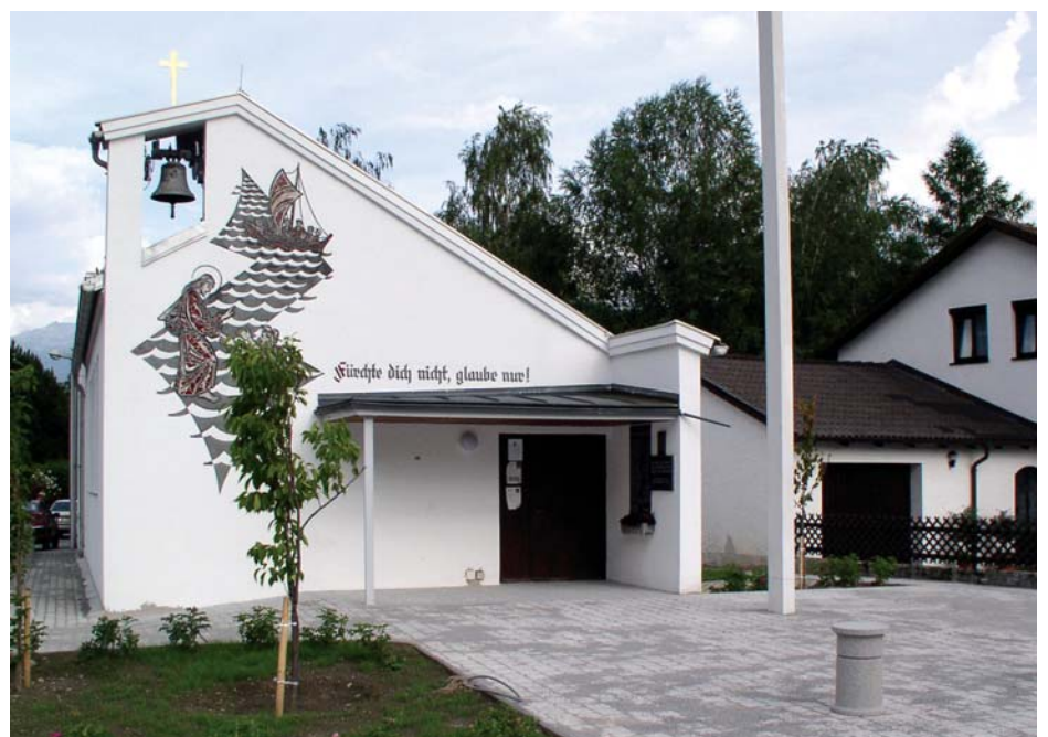
Die inzwischen renovierte (2001/2002) Kreuzkirche in Völs.