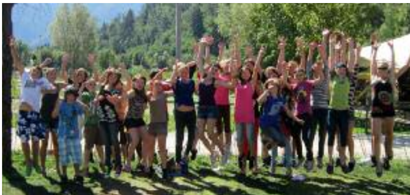
Die neuen Konfirmanden bei der warm-up Freizeit am Levicosee

Zu Beginn unseres gemeinsamen Konfikurses, welcher zum ersten Mal komplett von beiden Innsbrucker Gemeinden gemeinsam gestaltet wird, fuhren wir wie jedes Jahr für unsere Kennenlern-Freizeit an den schönen Levicosee! 30 Konfis und 7 MitarbeiterInnen verbrachten dort vier spannende Tage voller Outdoor-Spiele, Kennenlern-Aktivitäten und