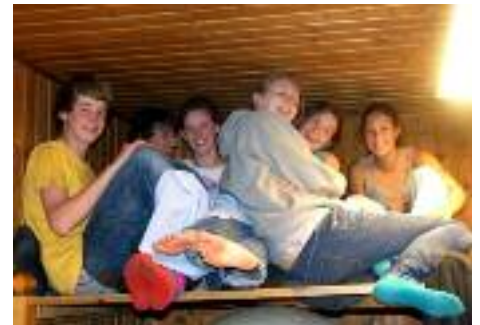
Mitarbeiter wärmen sich am Kachelofen