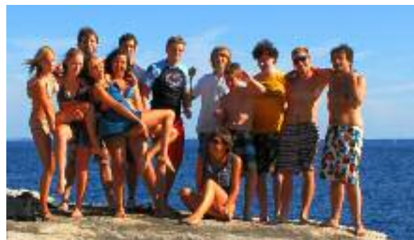
Kraft tanken für das nächste Jahr

Georg, zum Limski-Fjord und zur Geisterstadt Dvigrad ... das alles und noch viel „meer“ war die SO FREI Sommerfreizeit der EJ (EJ=Evangelische Jugend) Innsbruck!