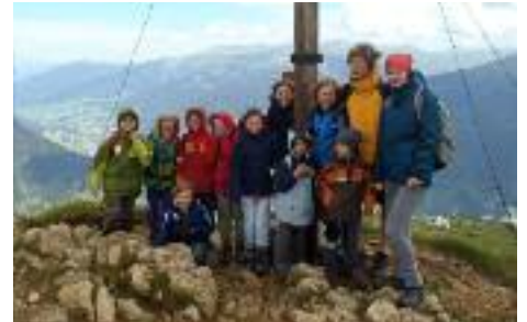
Stürmisches Gipfelfoto am Nöblachjoch

Trotz schlechtem Wetter hatten Kinder und MitarbeiterInnen großen Spaß bei der heurigen Kinderfreizeitwoche in Nösslach.