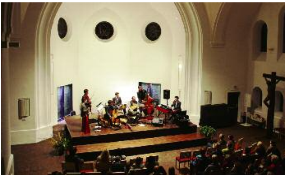
Ring Ensemble