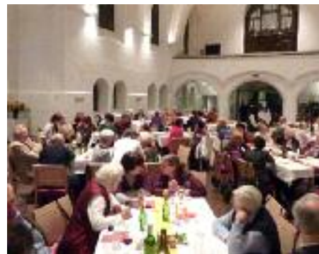
Mitarbeiterempfang in der Christuskirche

tinnen, vor allem um Asylsuchende, sie gestalten Gottesdienste und predigen, sie helfen mit im täglichen Leben der Gemeinden und bei besonderen Anlässen und vieles mehr. Das Ehrenamt in der evangelischen Kirche verwirklicht die reformatorische Überzeugung vom „Allgemeinen Priestertum aller Getauften“. Es gehört nach evangelischem Verständnis zur Kirche wesentlich dazu. Die Grundlage ist die biblisch begründete Überzeugung (1. Kor. 12,4 6), dass jeder und jede von Gott besondere Begabungen bekommen hat, die er und sie einbringen können und sollen. Ein wichtiger Bereich des Ehrenamtes ist die aktive Mitgestaltung des Lebens in der Kirche. Im Herbst