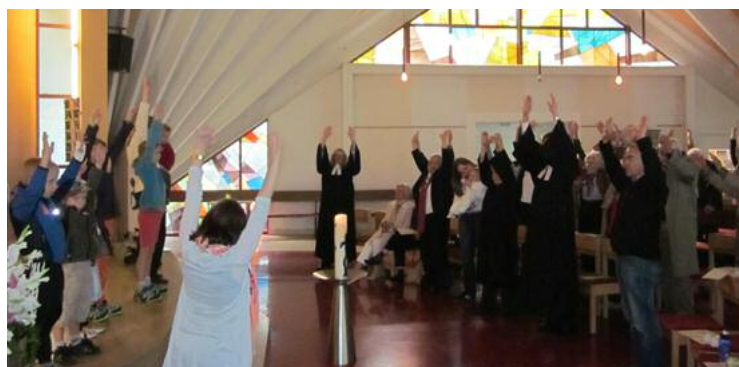
Familiengottesdienst zu Schulschluss

Die Familiengottesdienste gestalten wir sonntags um 10 Uhr in der Auferstehungskirche für jung und alt abwechs-