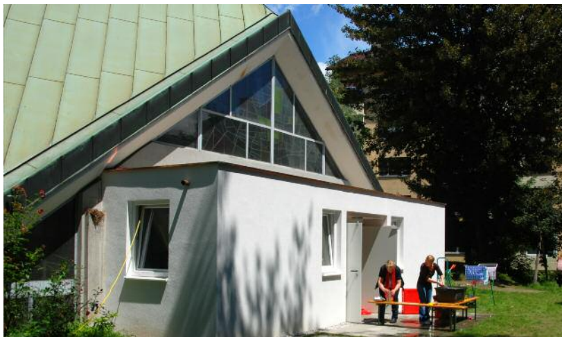
Zubau an der Auferstehungskirche

werden. Am 8. Juli konnten wir ihn und unseren neuen Kirchengang aber schon mit einem wunderbaren Stadtteil-Fest freudig feiern – gemeinsam mit dem benachbarten Haus Franziskus, der Handelsakademie und Handelsschule, dem Ungarischen StudentInnen-Heim und Kulturzentrum, der römisch-katholischen Pfarre Saggen, dem Verein für Psychische Gesundheit – pro mente tirol, dem Aufbauwerk der Jugend, den Kinderfreunden Tirol und den Barmherzigen Schwestern. Die Planung und Feier des gemeinsamen Festes hat uns Anrainer-Organisationen zusammengeführt, so hat die bauliche Neugestaltung auch bereits eine schöne Wirkung im persönlichen Miteinander bewirkt. Darüber freuen wir uns sehr und sind schon gespannt, was uns gemeinsam noch alles einfällt.