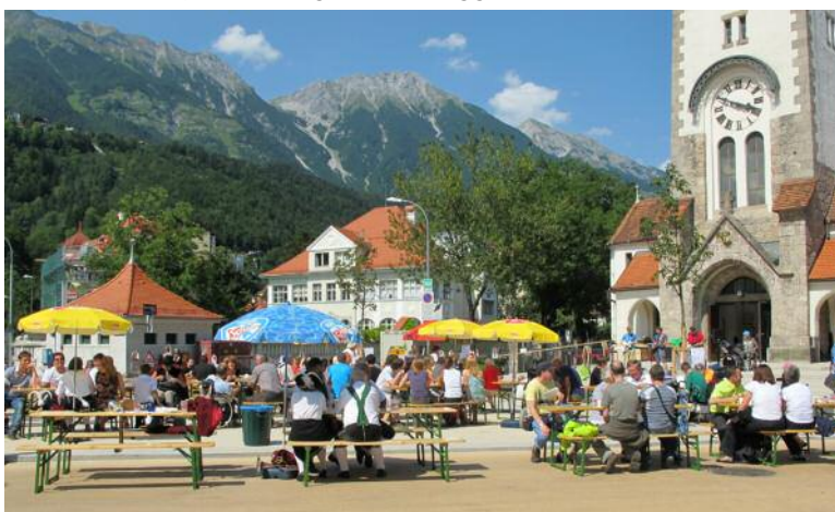
Stadtteilfest am 8.7. am neuen Martin-Luther-Platz