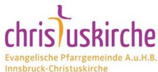
Evangelische Pfarrgemeinde A.u.H.B. Innsbruck-Christuskirche

In gut bewährter Tradition laufen wir auch heuer wieder zum Erntedankfest für einen guten, uns wichtigen Zweck.