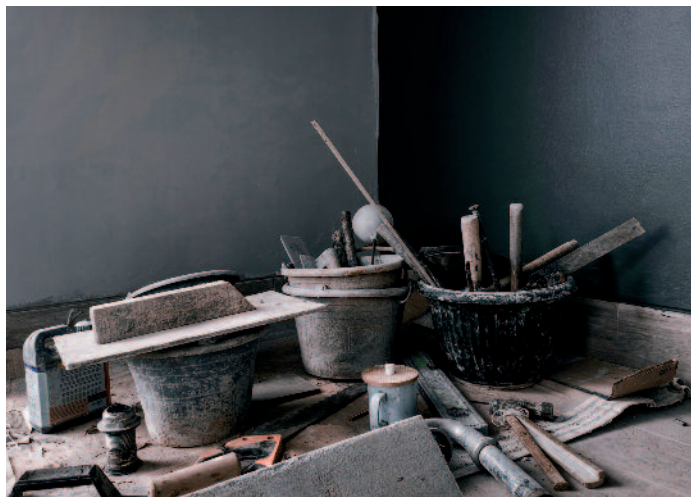
Ihr Redaktionsteam

Dieser Sommer-Brücke liegt ein Erlagschein bei, mit dem wir Sie bitten, die Arbeit des Gustav-Adolf-Vereins für Salzburg und Tirol zu unterstützen. Gebäude haben es leider an sich, dass sie in Schuss gehalten werden müssen, um den Anforderungen und dem Standard unserer Zeit zu entsprechen. Deshalb müssen in unseren Pfarrgemeinden immer wieder kirchliche Räume und Gebäude saniert oder umgebaut werden. Da dies oft viel Geld kostet, sind die Pfarrgemeinden dringend auf Ihre Hilfe angewiesen. Um weiterhin Bau- und Sanierungsprojekte mit Hilfe des Gustav-Adolf-Vereins in Salzburg und Tirol erfolgreich unterstützen zu können, bitten wir Sie darum herzlich um Ihre Spende mittels des beiliegenden Erlagscheins.